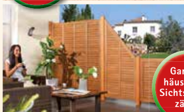
Garten- häuser und Sichtschutzzäune