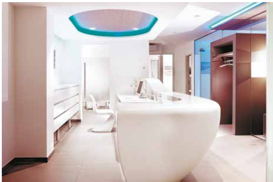
Vom Saarbrücker Architekturbüro OKINLAB entworfen, von der Schreinerei Raphael Haas innovativ umgesetzt: der Empfangsbereich einer Zahnarztpraxis.

► gene und porenlose Material besteht zu einem Drittel aus Acrylharz und zu zwei Dritteln aus dem natürlichen Mineral Aluminiumhydroxid, das aus dem Aluminium-Erz Bauxit gewonnen wird. Die hohe Verarbeitungsflexibilität der Platten, gekoppelt mit thermoplastischen Eigenschaften und einer unsichtbaren Verklebung, ermöglicht das Anfertigen von ganz individuellen Formteilen für die Anwendung sowohl