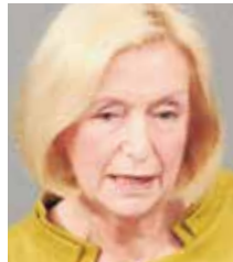
Johanna Wanka (63)