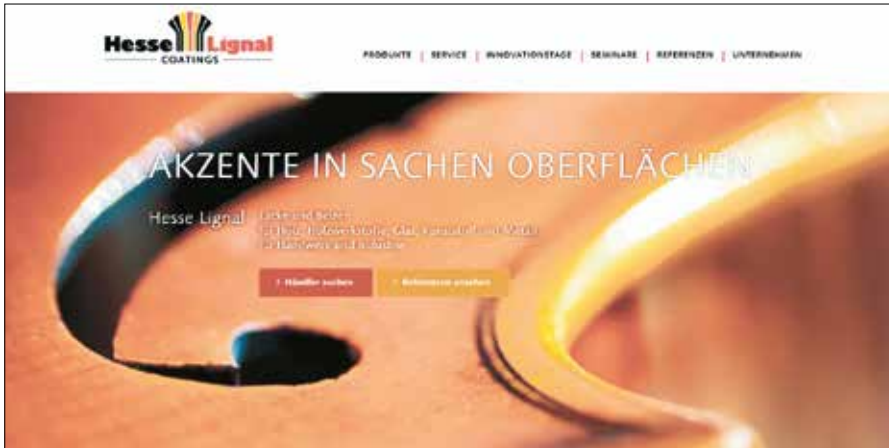
Die neue Website des Lack- und Beizenherstellers Hesse-Lignal aus Bockum-Hövel.