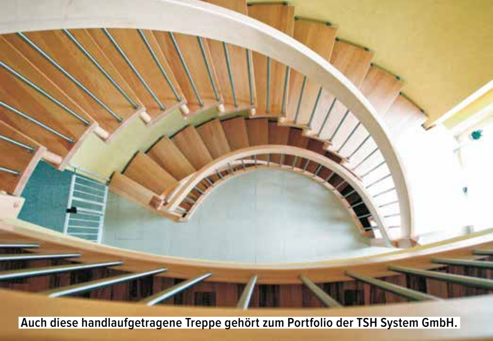
Auch diese handlaufgetragene Treppe gehört zum Portfolio der TSH System GmbH.