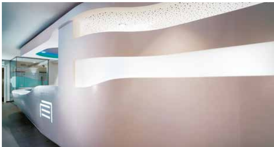
Hypermodern und wie aus einem Guss: Die Saar-Kooperation zwischen der Schreinerei Raphael Haas aus Elm und OKINLAB aus Saarbrücken kann sich sehen lassen.

vor Ort alles noch zu einer Einheit montiert werden.“