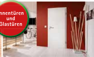
Innentüren und Glastüren