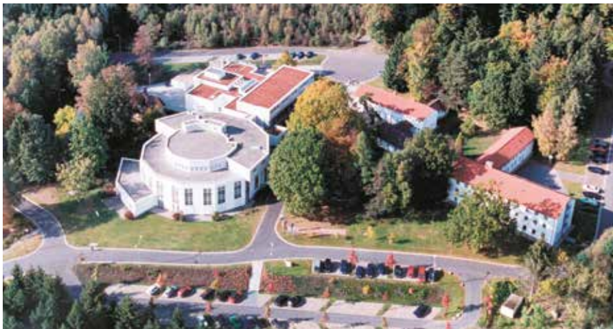
Die Europäische Akademie Otzenhausen ist Veranstaltungsort des Seminars.