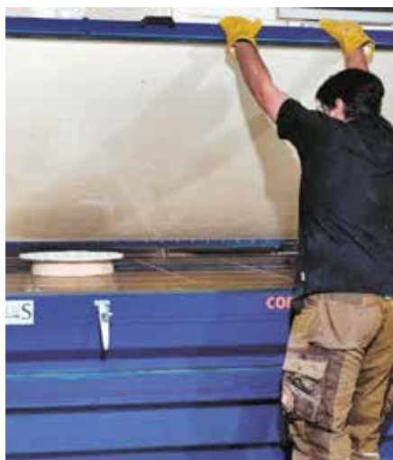
Ein Mitarbeiter von Raphael Haas bedient die Vakuumpresse, mit der das Staron-Material in Form gebracht wird.

Die interdisziplinäre Zusammensetzung des OKINLAB-Teams ermöglicht vom Entwurf bis zur Umsetzung ein effizientes Vorgehen. Dabei setzt man sich stets das Ziel, Funktionalität, Ergonomie und Ästhetik in Einklang zu bringen. Die Natur und ihr Streben nach Gleichgewicht und die Anpassung an sich ständig verändernde Bedingungen dienen dabei als Inspiration. Die Symbiose aus technischem Know-how und Bionik ermöglicht es dem innovativen Architekturbüro, bei Projekten Wünsche und Bedürfnisse sowie komplexeste Anforderungen systematisch zu erfassen, zu vereinfachen und bei der Realisierung nachhaltig zu erfüllen.