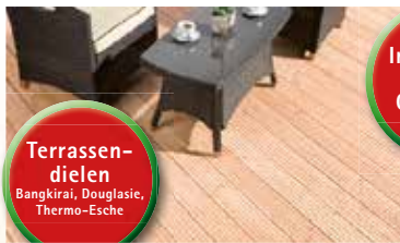
Terrassendielen Bangkirai, Douglasie, Thermo-Esche

Jeden Sonntag Schautag von 14 bis 17 Uhr (Keine Beratung, kein Verkauf!)