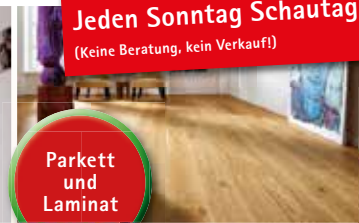
Parkett und Laminat