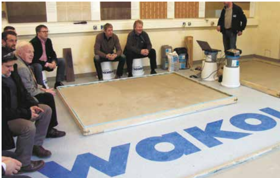
Die Gastgeber von der Firma WAKOL nutzen die Gelegenheit, sich der Parkettlegerrinnung Pfalz-Rheinhausen-Saarland zu präsentieren.