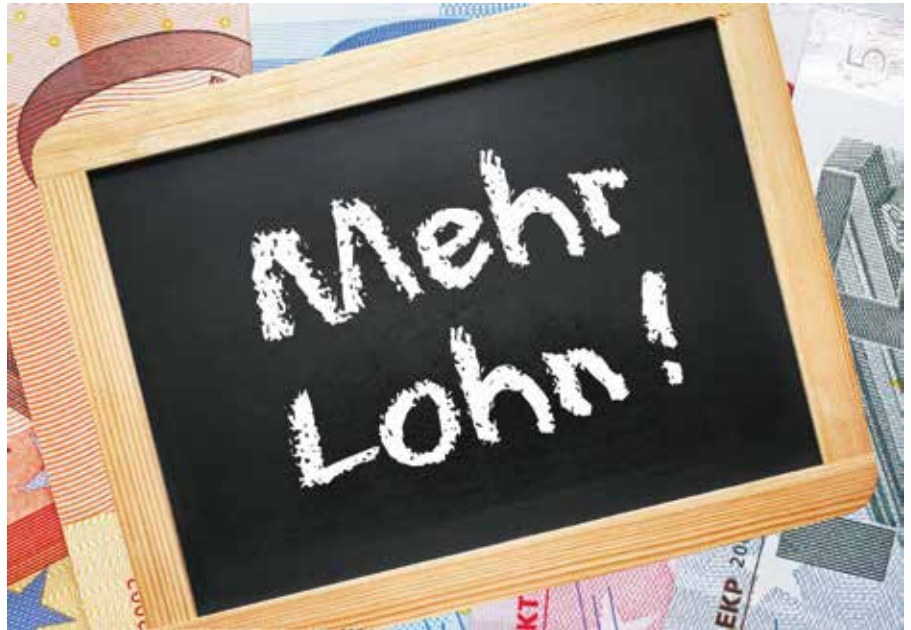
Das Arbeitsentgelt bei den Schreibern hat sich zum 1. Juni um 2,6 Prozent erhöht.

Demzufolge steigt das Arbeitsentgelt zum 1. Juni um 2,6 Prozent, was bedeutet, dass sich das Eckentgelt im Monat auf 2.560,97 Euro erhöht und demzufolge das Stundenentgelt von 15,10 Euro auf 15,49 Euro. In einem weiteren Schritt erhöht sich dann die Vergütung zum 1. Juli 2016 um weitere 2,1 Prozent mit einer Laufzeit bis zum 31. Mai 2017. Im Rahmen der Verhandlung wurde des Weiteren vereinbart, dass zum 1. Januar 2016 der Tarifvertrag zur Entgeltumwandlung ergänzt wird. Danach sollen die Beschäftigten einen Anspruch von einem Prozent des individuellen monatlichen Tarifentgeltes entsprechend ihrer Entgeltgruppe ohne Leistungszulage ohne Sonderzahlungen als Zuschuss zur Altersversorgung erhalten, wenn die Beschäftigten ihrerseits mindestens ein Prozent