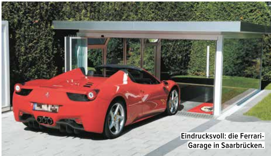
Eindrucksvoll: die Ferrari-Garage in Saarbrücken.

Der Bodenbelag wurde eigens von der Firma JAB Anstoetz angefertigt und gewebt mit dem Ferrari-Emblem und auf der Fahrerseite mit dem persönlichen Autogramm des Besitzer. Die Firma Rase hat auch die LED-Beleuchtung geliefert, die vom Wohnzimmer