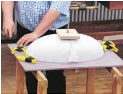
Das Spülbecken aus Staron wurde in eine Mineralwerkstoffplatte eingepasst.