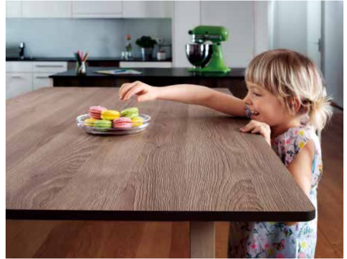
Mit neuen Dekoren und Strukturen macht der Holzhersteller EGGER aus Brilon Arbeitsplatten so authentisch wie nie zuvor.