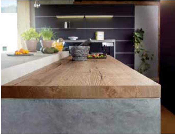
Die Synchronporenoberfläche Feelwood Rift ST37 mit ihrer markanten Tiefenstruktur verkörpert die gefragte Authentizität.