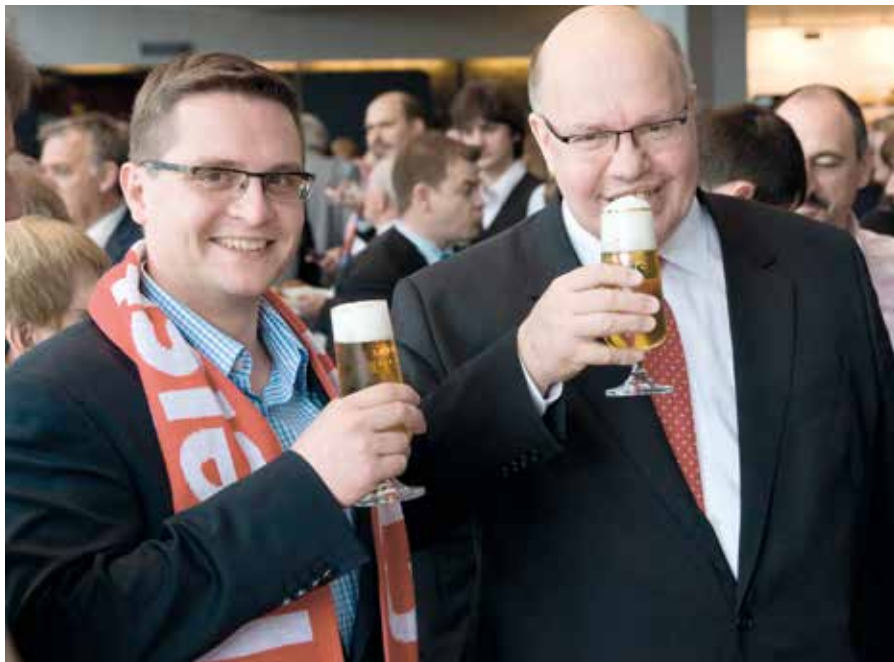
Bei der diesjährigen Meisterfeier der Handwerkskammer gratulierte auch Bundeskanzleramtschef Peter Altmaier (rechts) den Jungmeisterinnen und Jungmeistern.