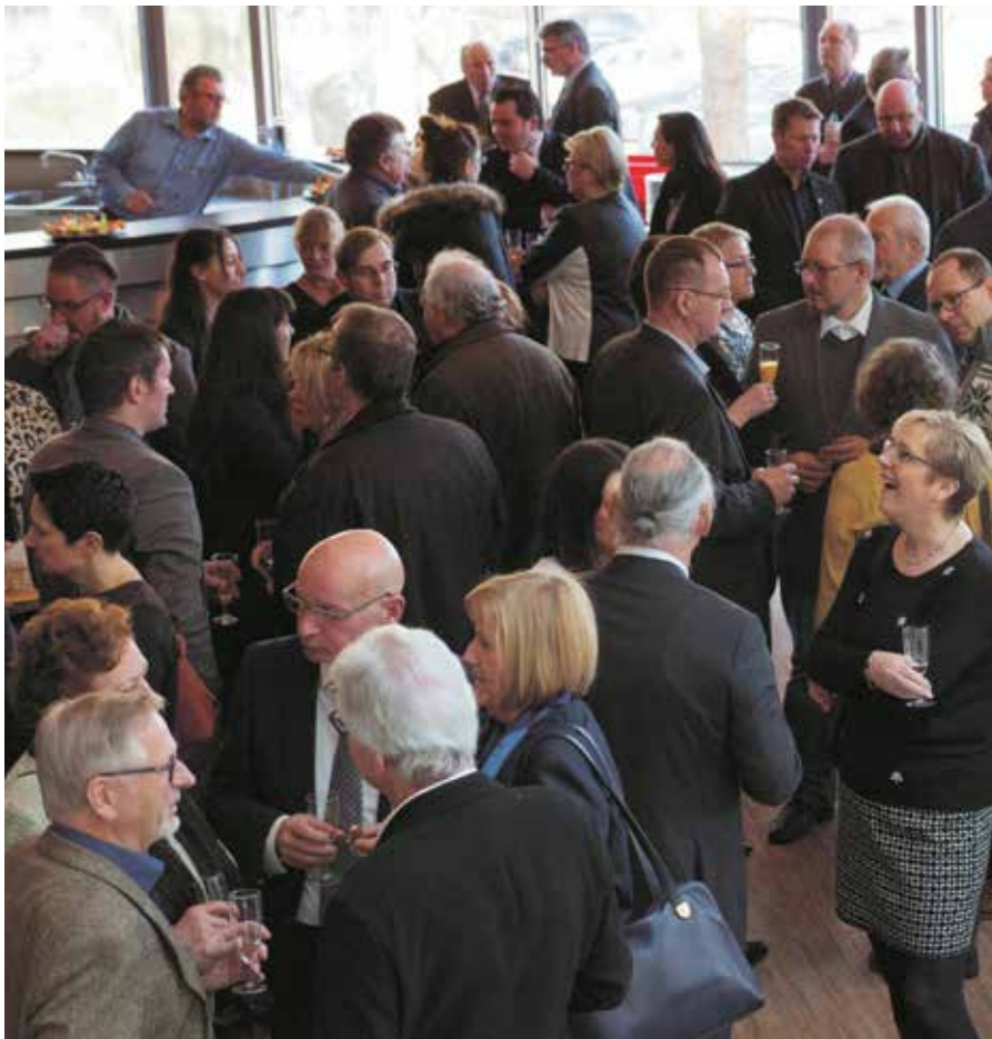
Das Warm-up zum Neujahrsempfang: Sekt und Häppchen im Foyer der Illipse.