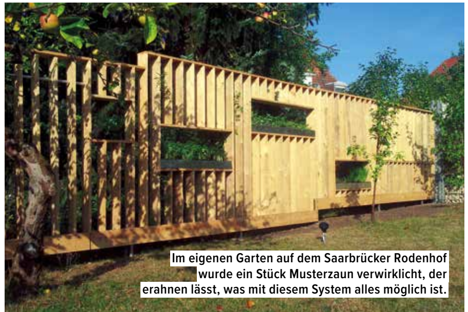
Im eigenen Garten auf dem Saarbrücker Rodenhof wurde ein Stück Musterzaun verwirklicht, der erahnen lässt, was mit diesem System alles möglich ist.

schen zwei bereits existierenden Fundamenten ist nach zusätzlich benötigter Lastaufnahmen ausgeschlossen. Des Weiteren kann ein Sichtschutzzaun bekannter Art nur schwerfällig auf die wechselnden Lebensumstände eines Nutzers reagieren und ist somit in seiner Gestaltungsfreiheit durch die sehr begrenzten Vorgaben der Hersteller in Bezug auf die Anordnung der Sichtschutzelemente stark eingeschränkt. Sichtschutzzäune bekannter Arten sind nicht für multiple Funktionen konzipiert. Zumeist dienen sie als Sichtschutz und sollen gut aussehen. Weitere funktionale Eigenschaften wie zum Beispiel die Aufbewahrungsmöglichkeiten für Gartenartikel bleiben außen vor. ▶