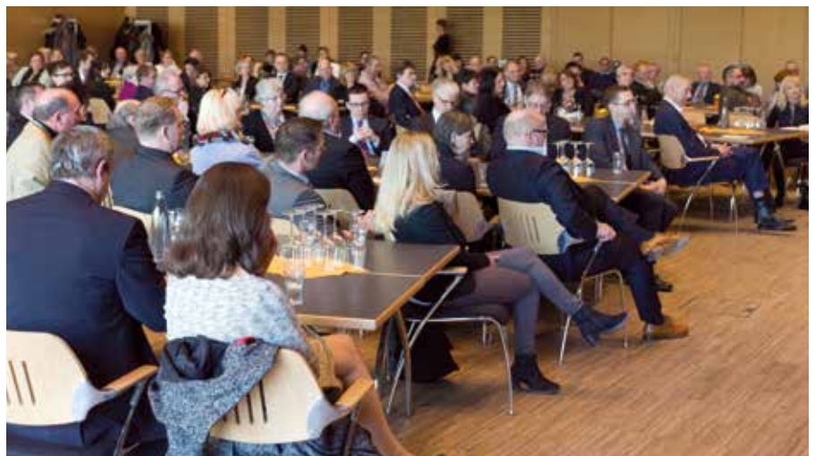
Gespannt lauschen rund 160 Verbandsmitglieder und Gäste beim Neujahrsempfang des Wirtschaftsverbandes Holz und Kunststoff Saar in Illingen den Rednern.