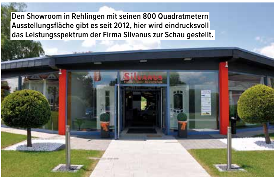
Den Showroom in Rehlingen mit seinen 800 Quadratmetern Ausstellungsfläche gibt es seit 2012, hier wird eindrucksvoll das Leistungsspektrum der Firma Silvanus zur Schau gestellt.

Wenn dieses eine (große) Problem nicht wäre, könnte man nicht klagen, denn das Geschäftsmodell von „Silvanus – Türen, Fenster, Sonnenschutz“ funktioniert – und zwar folgendermaßen: Jede Holzhaustür, die den Betrieb verlässt, ist ein Unikat, wird also individuell am stetig wachsenden Standort in Rehlingen-Siersburg entworfen und nach Kundenwunsch gefertigt. Während wiederum die Fenster, Innentüren, Rollläden und die übrigen Sonnenschutzelemente im Portfolio