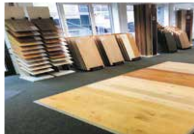
Bei Holz-Wickert findet sich derzeit auf 250 Quadratmetern eine Übergangsausstellung.

Derzeit ist der Bauantrag für den Neubau eingereicht und wird behördlich bearbeitet. Er sieht eine neue Lagerhalle von etwa 10.000 Quadratmetern sowie eine neue Expo Holz auf 2.500 Quadratmetern Ausstellungsfläche mit einem Abholmarkt vor.