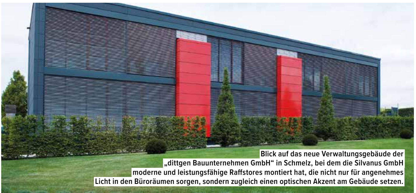
Blick auf das neue Verwaltungsgebäude der „dittgen Bauunternehmen GmbH“ in Schmelz, bei dem die Silvanus GmbH moderne und leistungsfähige Raffstores montiert hat, die nicht nur für angenehmes Licht in den Büroräumen sorgen, sondern zugleich einen optischen Akzent am Gebäude setzen.