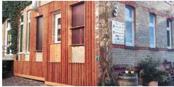
Öffentlich zugänglich ist im „Werkhof Nauwieser 19“ in Saarbrücken diese Fassadenverkleidung im „Fendow“-Systembau.

► „Wir wollten deshalb ein Lamellensichtschutzzaunsystem im Baukastenprinzip schaffen, das bewusst die Möglichkeit bietet, nach dem Aufbau Komponenten zu verändern. In unser System lassen sich mit integrierten Bauöffnungen beispielsweise Pflanzkästen, Schränke, Vogelbrut- und Futterkästen, Sitzbänke und Tische, Briefkästen, Müllimer, Lautsprecher und sogar Beleuchtungselemente integrieren. Der Fantasie des Bauherren sind hier letztlich keine Grenzen gesetzt.“ Durch die kleinteiligen Zaunbauelemente im Do-it-yourself-Baukasten wird dem Nutzer ein Höchstmaß an Gestaltungsfreiheit ermöglicht. Im Idealfall kann