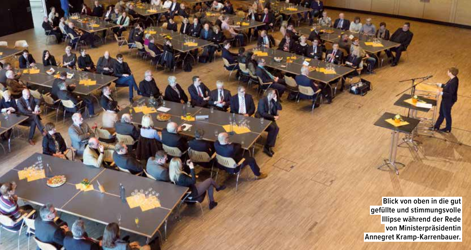
Blick von oben in die gut gefüllte und stimmungsvolle Illipse während der Rede von Ministerpräsidentin Annegret Kramp-Karrenbauer.