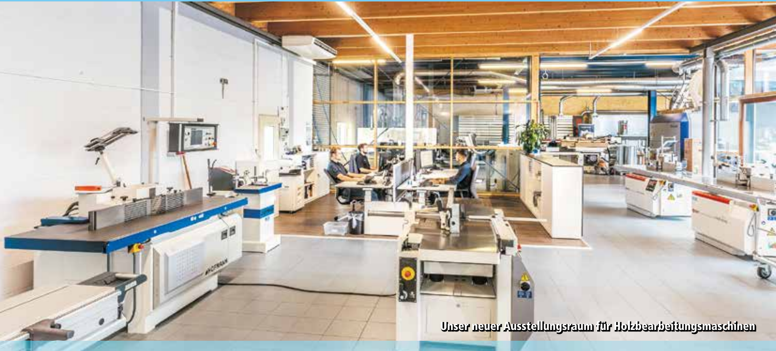
Unser neuer Ausstellungsraum für Holzbearbeitungsmaschinen