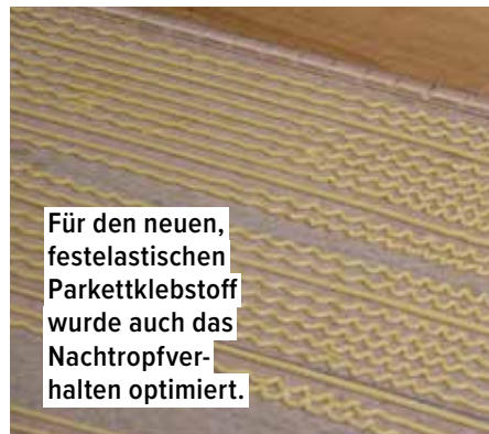
Für den neuen, festelastischen Parkettklebstoff wurde auch das Nachtropfverhalten optimiert.

vorträge und Produktvorführungen unter dem Thema: „Abdichtungssysteme von Feuchträumen im häuslichen Wohnbereich für Parkett und elastische Beläge“, eine Thematik, die auch bei den angehenden Schreinermeistern auf großes Interesse stieß. Aufmerksam verfolgten die Schüler des Jahrgangs 2017/18 der Saarländischen Meister- und Technikerschule (SMTS) im Schreinerhandwerk, die ebenfalls Gäste an diesem Tag waren, den Ausführungen in Theorie und