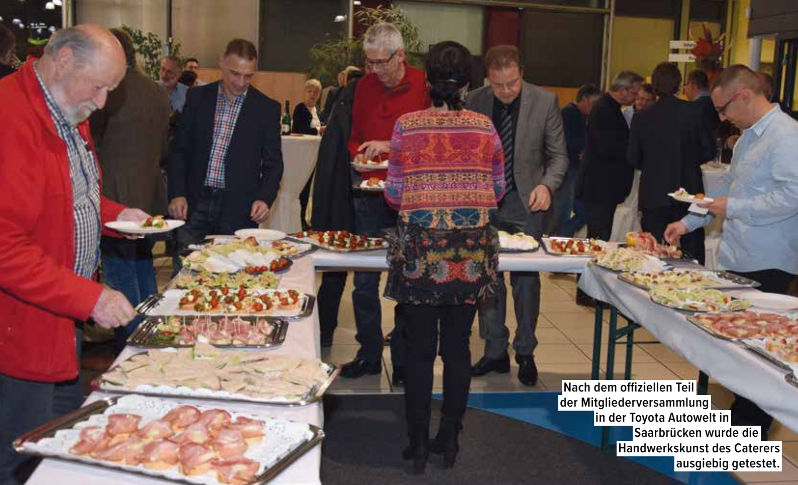
Nach dem offiziellen Teil der Mitgliederversammlung in der Toyota Autowelt in Saarbrücken wurde die Handwerkskunst des Caterers ausgiebig getestet.