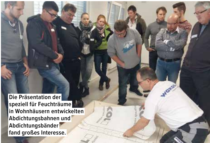
Die Präsentation der speziell für Feuchträume in Wohnhäusern entwickelten Abdichtungsbahnen und Abdichtungsbänder fand großes Interesse.