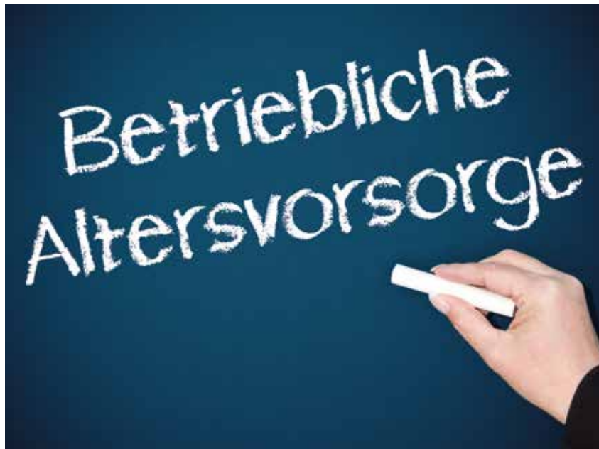
Die Regelungen des neuen Betriebsrentenstärkungsgesetzes sind komplex. Für saarländische Wohnhandwerker gibt es bereits seit Jahren eine Lösung.

müssen, für die der Arbeitgeber selbst schon 30 Prozent Pauschalsteuer abgeführt hat. Die ursprüngliche Regelung war einfach und klar und wurde durch den Gesetzgeber unnötig beschädigt. Alle folgenden Reformgesetze zur betrieblichen Altersvorsorge blieben ineffektiv und bürokratisch. ■