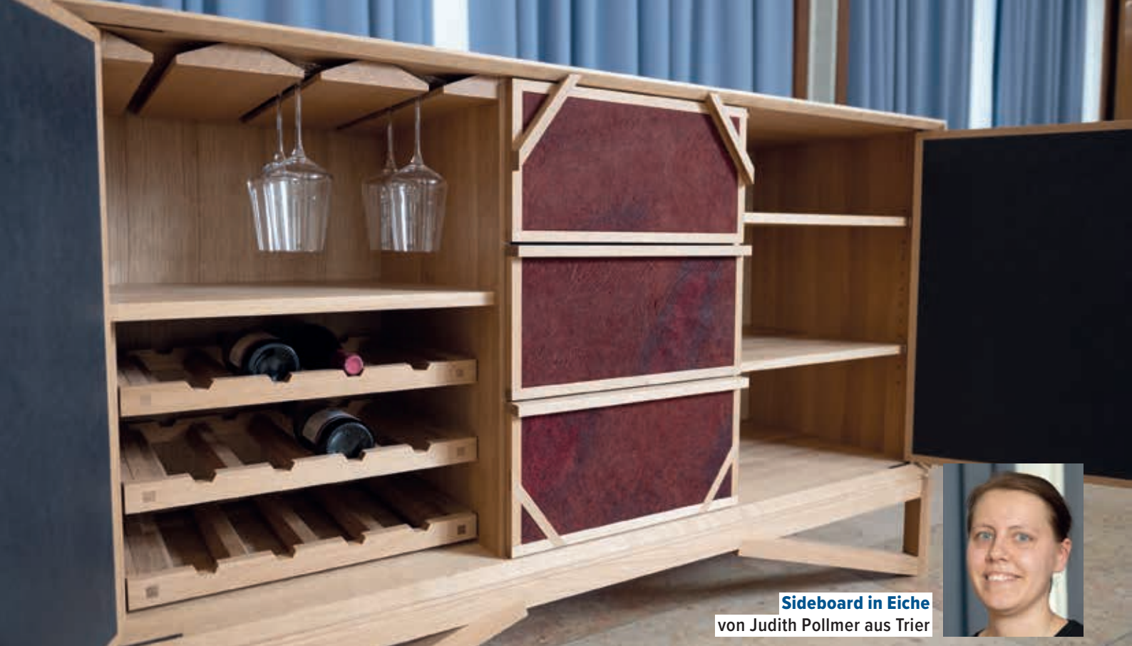
Sideboard in Eiche von Judith Pollmer aus Trier