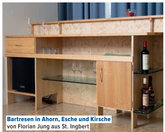
Bartresen in Ahorn, Esche und Kirsche von Florian Jung aus St. Ingbert