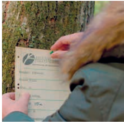
Bei SCHMIDT wird der Herstellungsprozess eines Produktes zertifiziert und durch unabhängige Gutachter geprüft.

Die Kunden können sich bei SCHMIDT darauf verlassen, dass der gesamte Herstellungsprozess ihres Produktes zertifiziert ist und durch unabhängige Gutachter geprüft wird. „Da sehen wir uns durchaus als Öko-Pioniere. Die Struktur als traditionsreiches Familienunternehmen bedingt, in Generationen und nicht in Quartalen zu denken. Deshalb ist eine nachhaltige Entwicklung eines unserer wichtigsten Ziele“, sagt Leitzgen. An vielen Stellen konnte der 1934