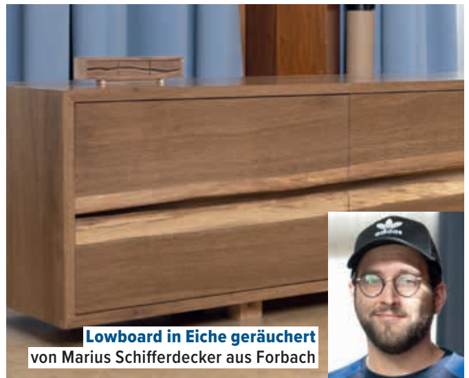
Lowboard in Eiche geräuchert von Marius Schifferdecker aus Forbach