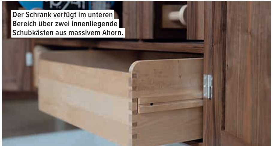
Der Schrank verfügt im unteren Bereich über zwei innenliegende Schubkästen aus massivem Ahorn.

geben. Und als er eineinhalb Jahre war, hat ihn sein Opa mit dem Akkuschauber vertraut gemacht. Eine seiner ersten Amtshandlungen als ‚Schreinermini‘ knapp ein Jahr später: Erstmals den Sandkasten in seine Einzelteile zerlegen – der Akkuschauber war auf Linkslauf gestellt.“ Da wusste jemand schon sehr früh, was er wollte. Nur konsequent und logisch, dass er nach der Mittleren Reife bei der Schreinerei Jung in Nohfelden-Selbach in die Lehre ging. Muss wohl gut gewesen sein, sonst hätte ihn Vater Christian nicht dazu überreden können, gleich die