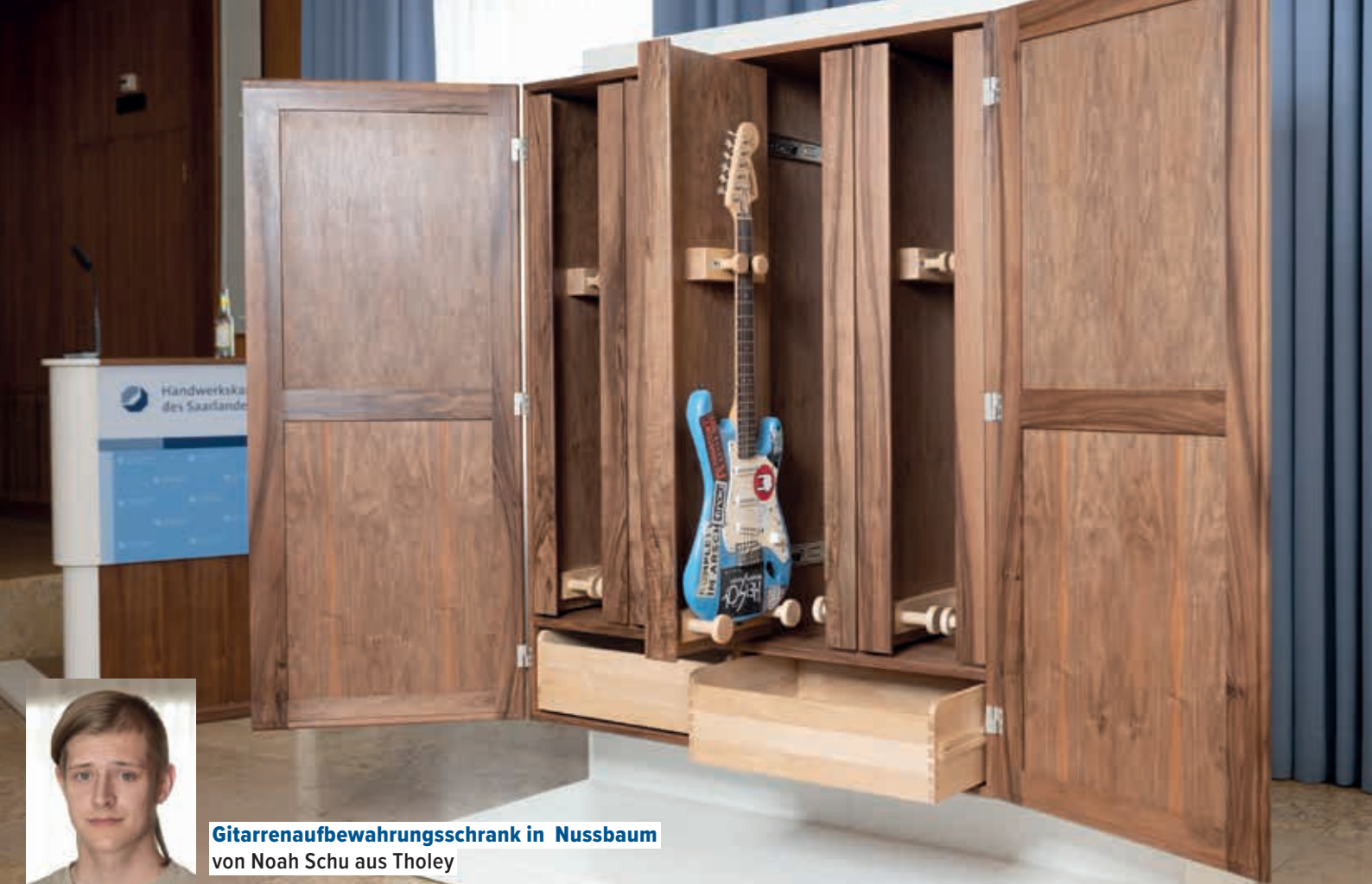
Gitarrenaufbewahrungsschrank in Nussbaum von Noah Schu aus Tholey