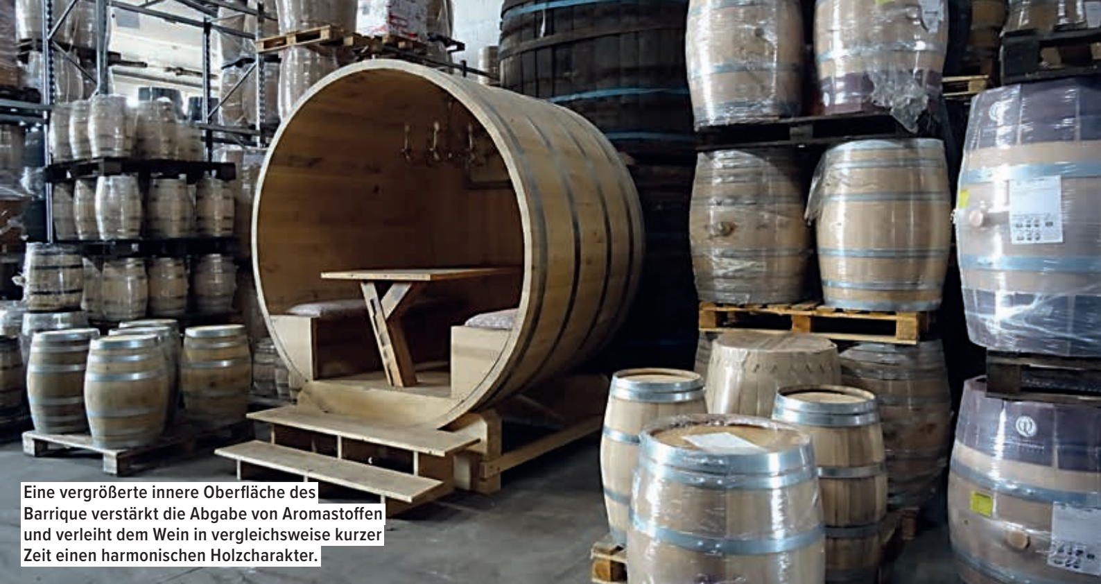
Eine vergrößerte innere Oberfläche des Barrique verstärkt die Abgabe von Aromastoffen und verleiht dem Wein in vergleichsweise kurzer Zeit einen harmonischen Holzcharakter.

stamm kostet uns rund 8.000 Euro und aufgrund des speziellen Zuschnitts im Spiegelschnitt haben wir einen recht hohen Verschnitt.“