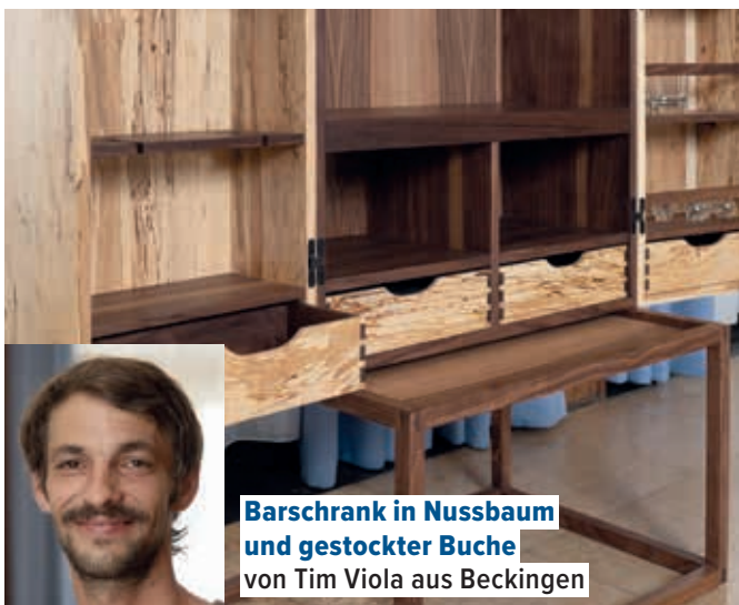
Barschrank in Nussbaum und gestockter Buche von Tim Viola aus Beckingen