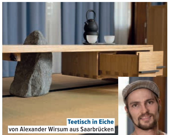
Teetisch in Eiche von Alexander Wirsum aus Saarbrücken