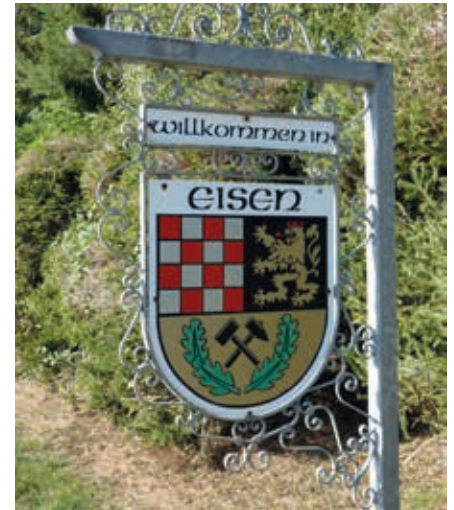
Das Ortsschild des Nohfeldener Ortsteils Eisen, dem Firmensitz der Schreinerei Schu. Deshalb: „Holz aus Eisen!“