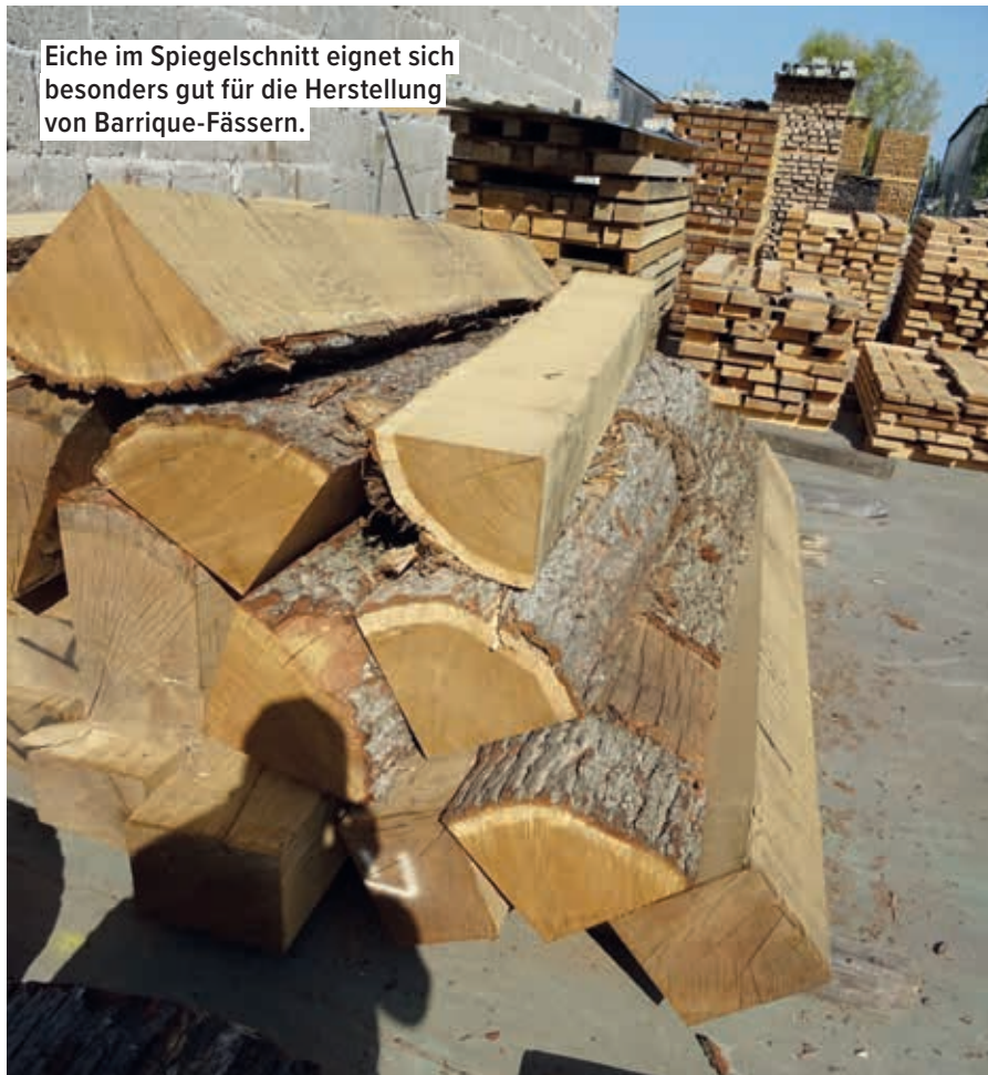
Eiche im Spiegelschnitt eignet sich besonders gut für die Herstellung von Barrique-Fässern.