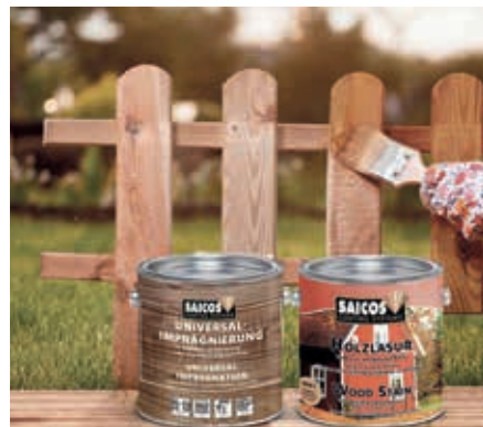
Die perfekte Kombination für alle Gartenhölzer: Universalimprägnierung und Holzlasur von SAICOS.