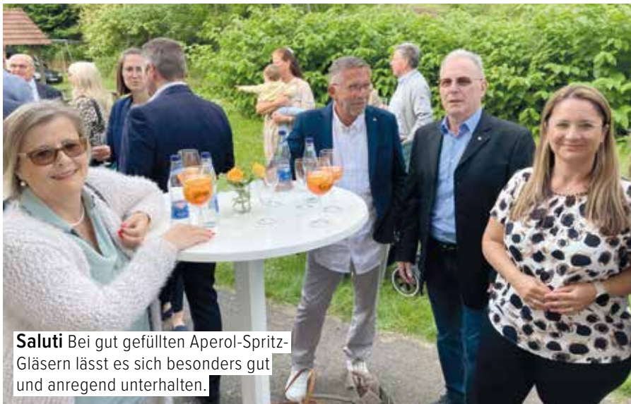
Saluti Bei gut gefüllten Aperol-Spritz-Gläsern lässt es sich besonders gut und anregend unterhalten.