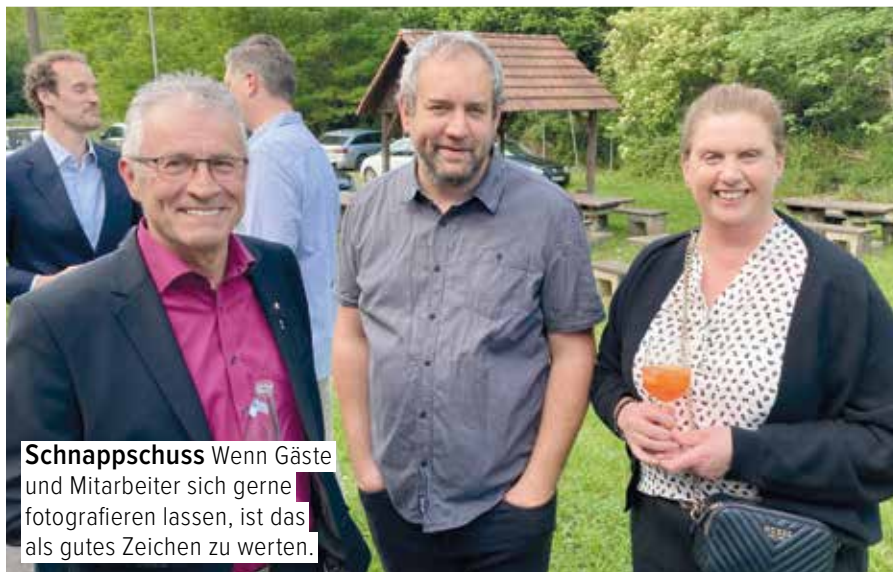
Schnappschuss Wenn Gäste und Mitarbeiter sich gerne fotografieren lassen, ist das als gutes Zeichen zu werten.