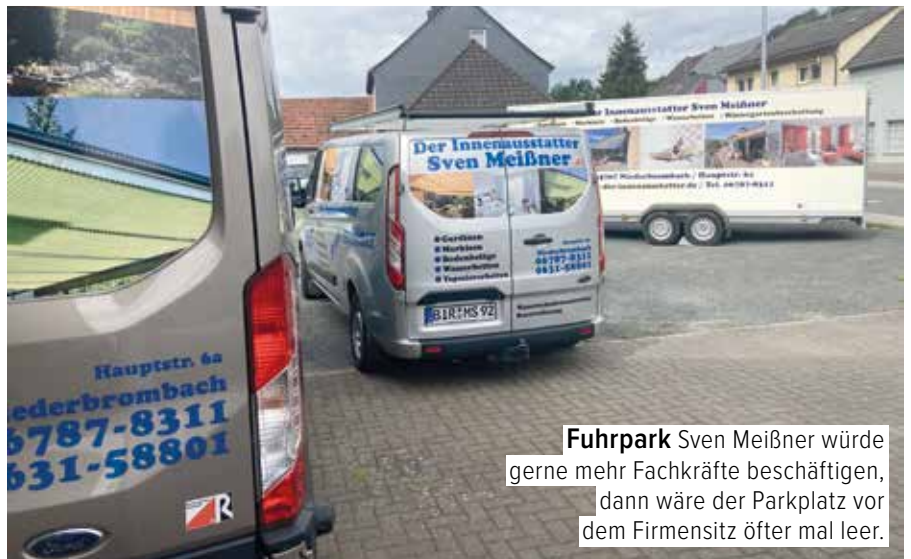
Fuhrpark Sven Meißner würde gerne mehr Fachkräfte beschäftigen, dann wäre der Parkplatz vor dem Firmensitz öfter mal leer.