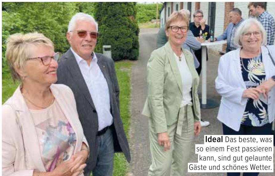
Ideal Das beste, was so einem Fest passieren kann, sind gut gelaunte Gäste und schönes Wetter.