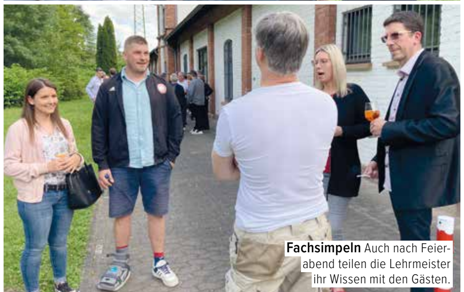
Fachsimpeln Auch nach Feierabend teilen die Lehrmeister ihr Wissen mit den Gästen.