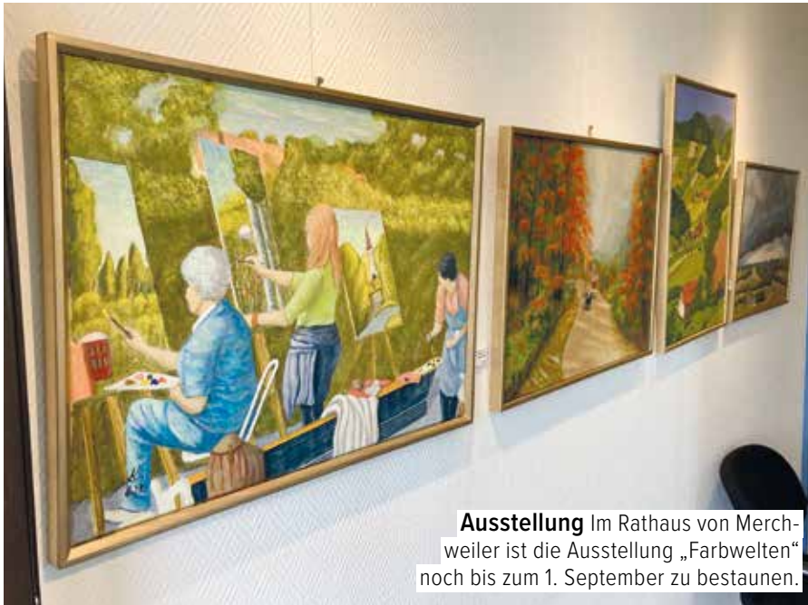
Ausstellung Im Rathaus von Merchweiler ist die Ausstellung „Farbwelten“ noch bis zum 1. September zu bestaunen.

► heiratet ist. Dass er dabei charmant lächelt, spricht für sich. Es sind Motive aus dem Leben, die ihn reizen. Zu sehen etwa auf dem Gemälde „Bäckerei“, inspiriert von einem Besuch beim St. Ingberter Altstadtfest. Gerne darf es aber auch etwas