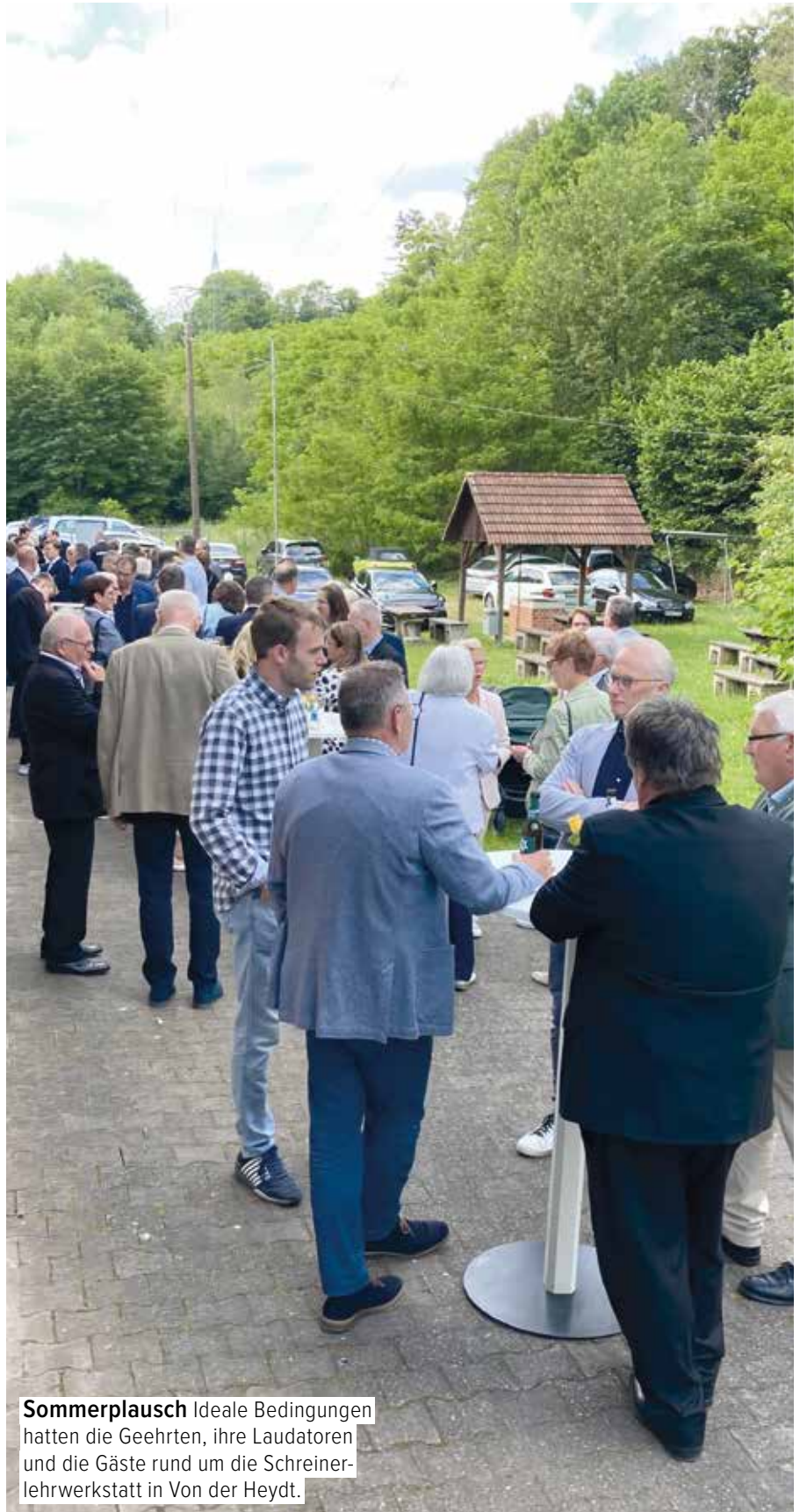
Sommerplausch Ideale Bedingungen hatten die Geehrten, ihre Laudatoren und die Gäste rund um die Schreinerlehrwerkstatt in Von der Heydt.

Kein Wunder, denn die Rede war von „einer herausragenden Persönlichkeit“, deren beeindruckende Karriere im Schreinerhandwerk zu würdigen ►