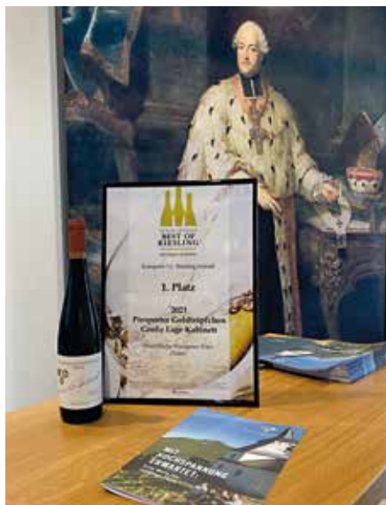
Ausgezeichnet Nicht selten werden die Rieslinge des Weinguts auch prämiert.