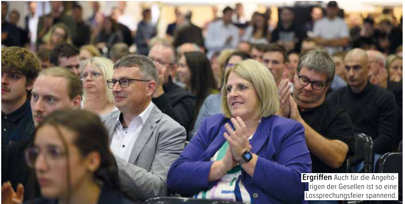
Ergriffen Auch für die Angehörigen der Gesellen ist so eine Lossprechungsfeier spannend.