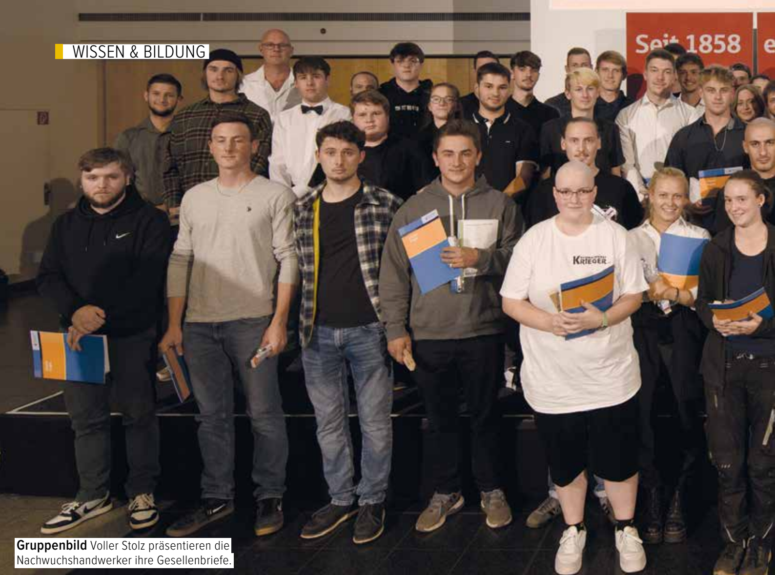
Gruppenbild Voller Stolz präsentieren die Nachwuchshandwerker ihre Gesellenbriefe.