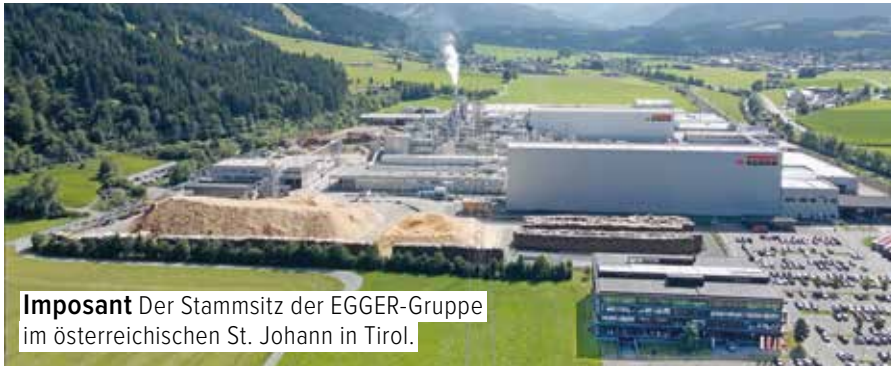
Imposant Der Stammsitz der EGGER-Gruppe im österreichischen St. Johann in Tirol.