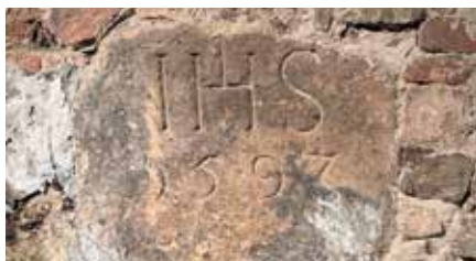
Details Wer einen Blick für Altertümliches hat, wird im Weinkeller reich bedacht.

► hen auf der Exportliste. Dort finden sich auch Kunden aus China, Südamerika, Japan und sogar Taiwan. Außerhalb der heimischen Weinanbauregionen darf der Bekanntheitsgrad noch