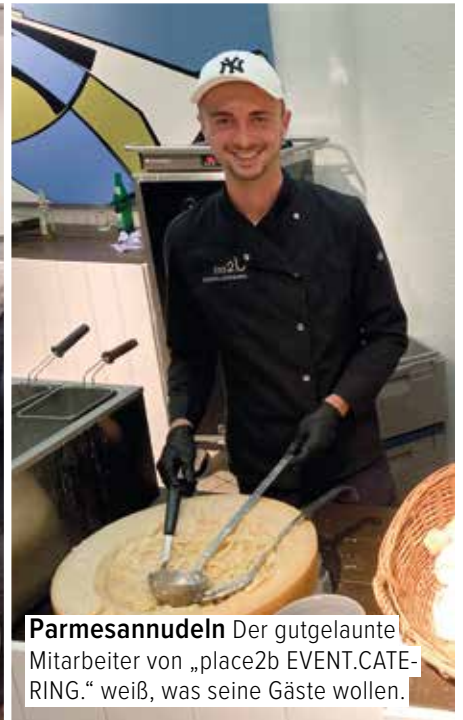
Parmesannudeln Der gutgelaunte Mitarbeiter von „place2b EVENT.CATERING.“ weiß, was seine Gäste wollen.