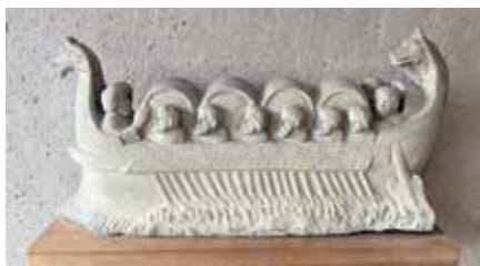
Antik In den Räumlichkeiten des Weinguts gibt es manchen Schatz zu entdecken.