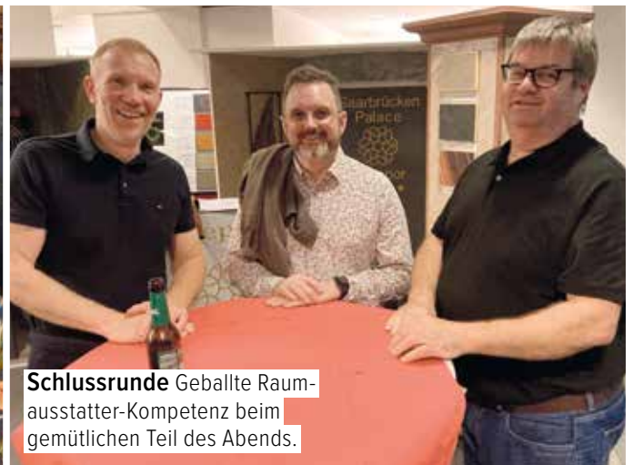
Schlussrunde Geballte Raumausstatter-Kompetenz beim gemütlichen Teil des Abends.