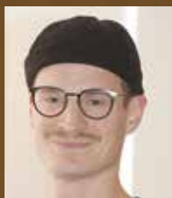
Schallplatten- spieler-Turm in Nussbaum- Furnier