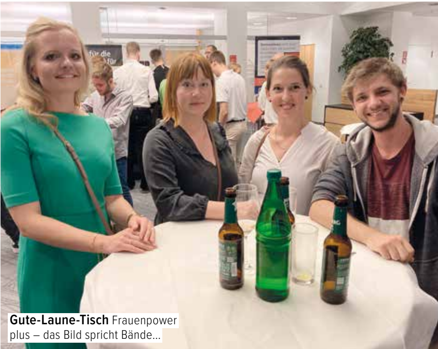
Gute-Laune-Tisch Frauenpower plus – das Bild spricht Bände...